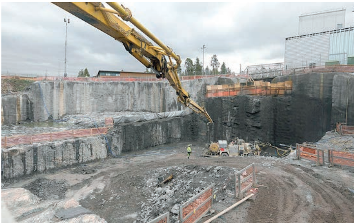
Рис. 2. Котлован для заложения фундамента будущего завода по инкапсуляции финского ОЯТ

были завершены работы в рамках второго этапа по сооружению здания вентиляторной станции. Горнопроходческие работы по сооружению самого пункта захоронения были начаты в декабре 2016 года. На данный момент продолжается проходка транспортного заезда, спускающегося на глубину заложения ПГЗРО. Общая продолжительность первого этапа работ по сооружению ПГЗРО оценивается в два с половиной года.